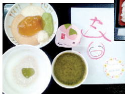
春の行事食（ペースト食）