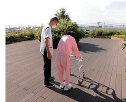
気分転換を兼ねた歩行練習

体調を少しでも健やかに保ち、自分らしい療養生活を送っていただけるよう、1日20分～40分程度のリハビリを行っています。個々にあったリハビリもお受けいただけます。