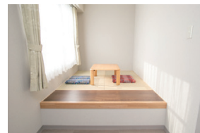
畳のスペースが付いた有償個室もございます