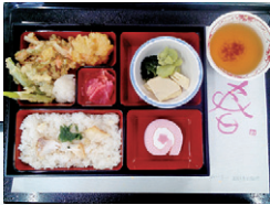
春の行事食（普通食）