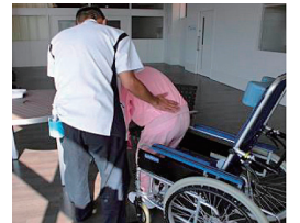
状態に応じた移乗練習